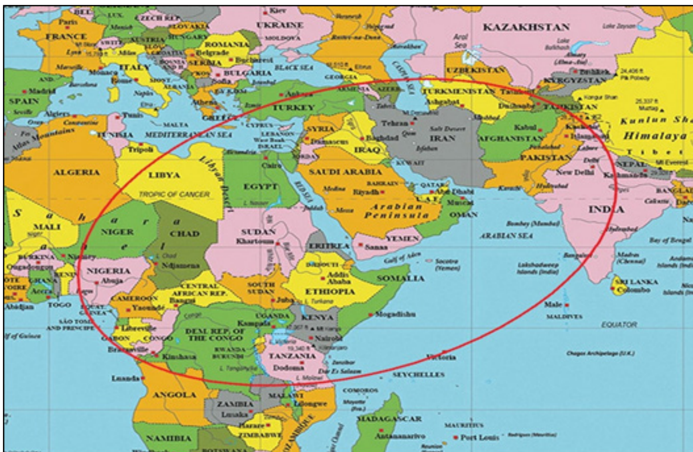
Figura 3: Elipse afroasiática (Fuente: Elaboración propia).