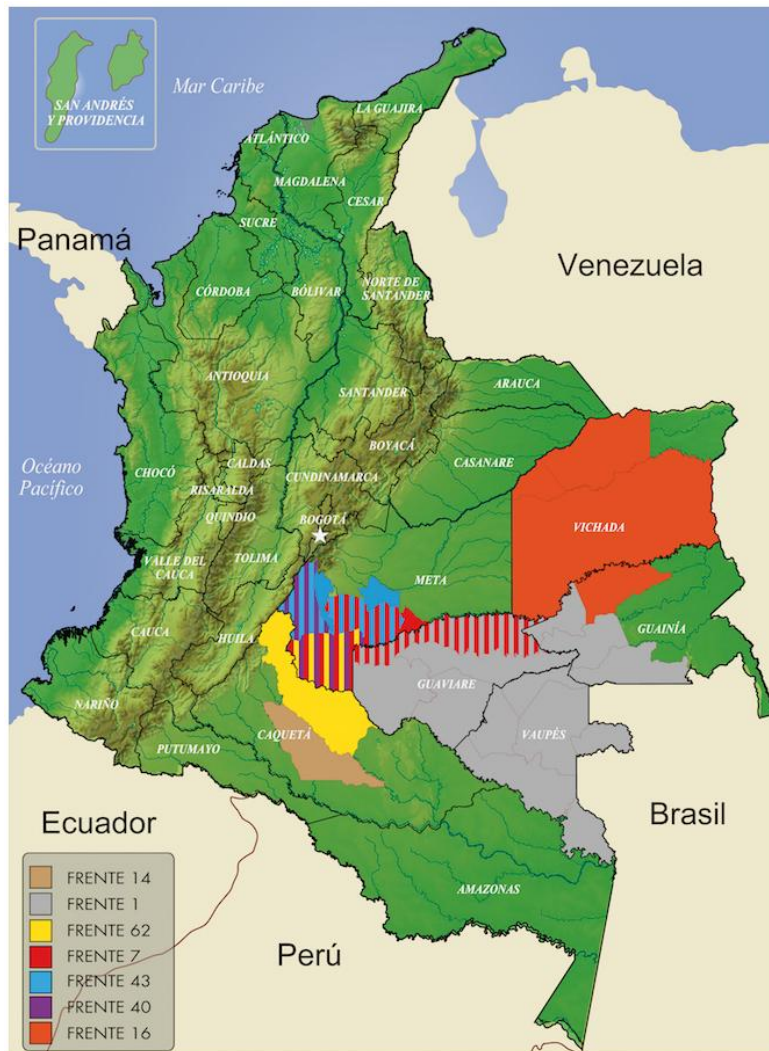
Figura 1. Operatividad de las FARC en territorio colombiano, 2016