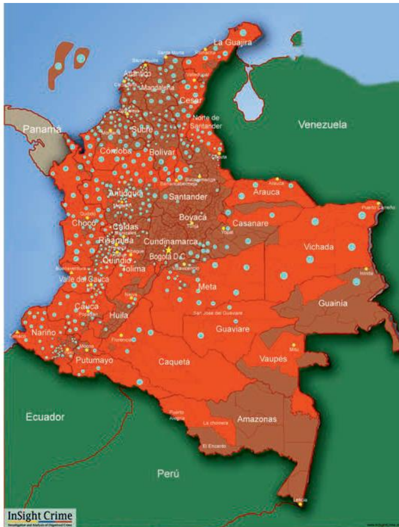
Figura 4. Coexistencia de FARC y Bacrim en territorio colombiano, 2015

Fuente: MCDERMOTT, Jeremy. ¿Cómo se verá el panorama criminal tras un acuerdo de paz con las FARC?, 2015.