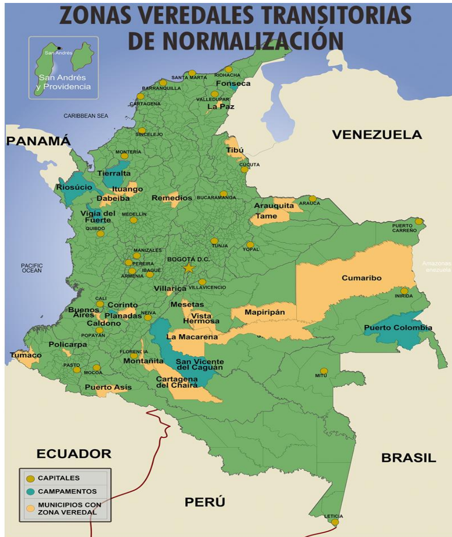
Figura 3. Zonas veredales transitorias de normalización en territorio colombiano