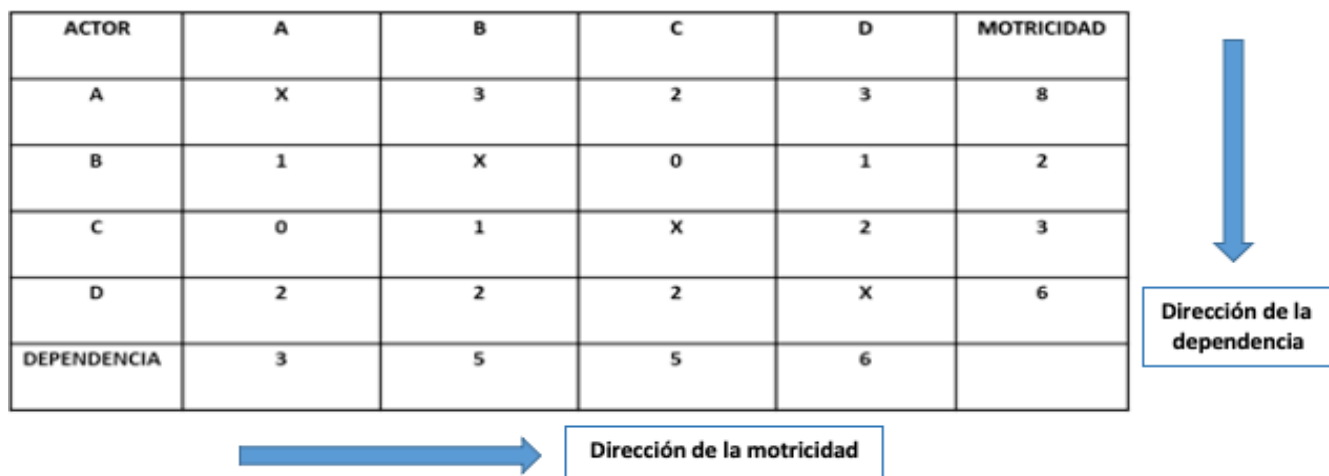
Grafico N°2: Matriz de influencia – dependencia de los actores

Elaboración propia, a partir de la teoría de Análisis Estructural.